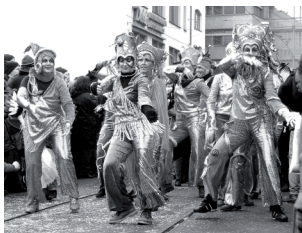
Auftritt beim Bremer,Carneval Animal'

Die Tanzgruppe minha dança richtet sich an tanz- oder bewegungserfahrene Menschen, die dazu bereit sind, beim Bremer Karneval an einer Tanzvorführung teilzunehmen. Es werden mehre Choreografien eingeübt und die Kostüme werden gemeinsam gestaltet. Das Sambatanzprojekt findet von September bis Februar bis zum Bremer Karneval statt.